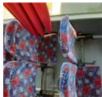
Autobuze – eliminarea sezuturilor scaunelor alaturate