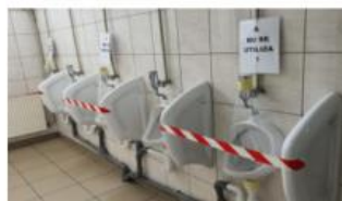
Eliminarea toaletelor apropiate