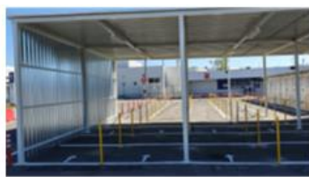
Verificarea temperaturii inainte de intrarea pe poarta