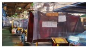
Montarea de protectii in zonele de sudura