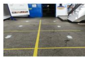
Separarea fluxurilor la intrarea in sectii