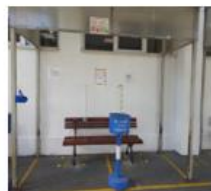
Reorganizarea spatiilor de fumat