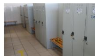
Distantarea vestiarelor si organizarea de fluxuri