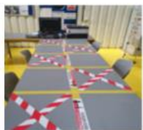
Reorganizarea spatiilor de UEL