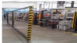
Montarea de protectii in asamblajul TL