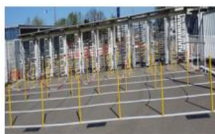
Separarea fluxurilor dupa intrarea pe poarta