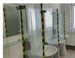
Montarea protectiilor de plastic la chiuvete