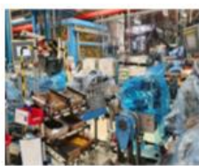
Montarea de protectii in asamblajul H4