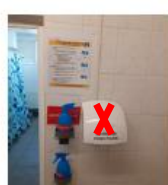
Stabilirea unui mod de folosire a dusurilor