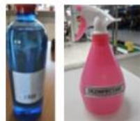
Validare si aprovizionare materiale de dezinfectie si de protectie