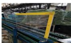
Montarea de protectii in Puncti