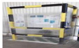
Amenajare zone asteptare soferi in GR