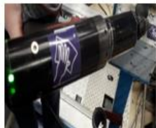
Etichetare obiecte care vor fi dezinfectate