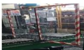
Montarea de protectii in Turnatorie