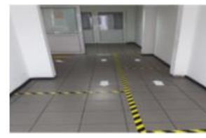
Separarea fluxurilor la vestiare